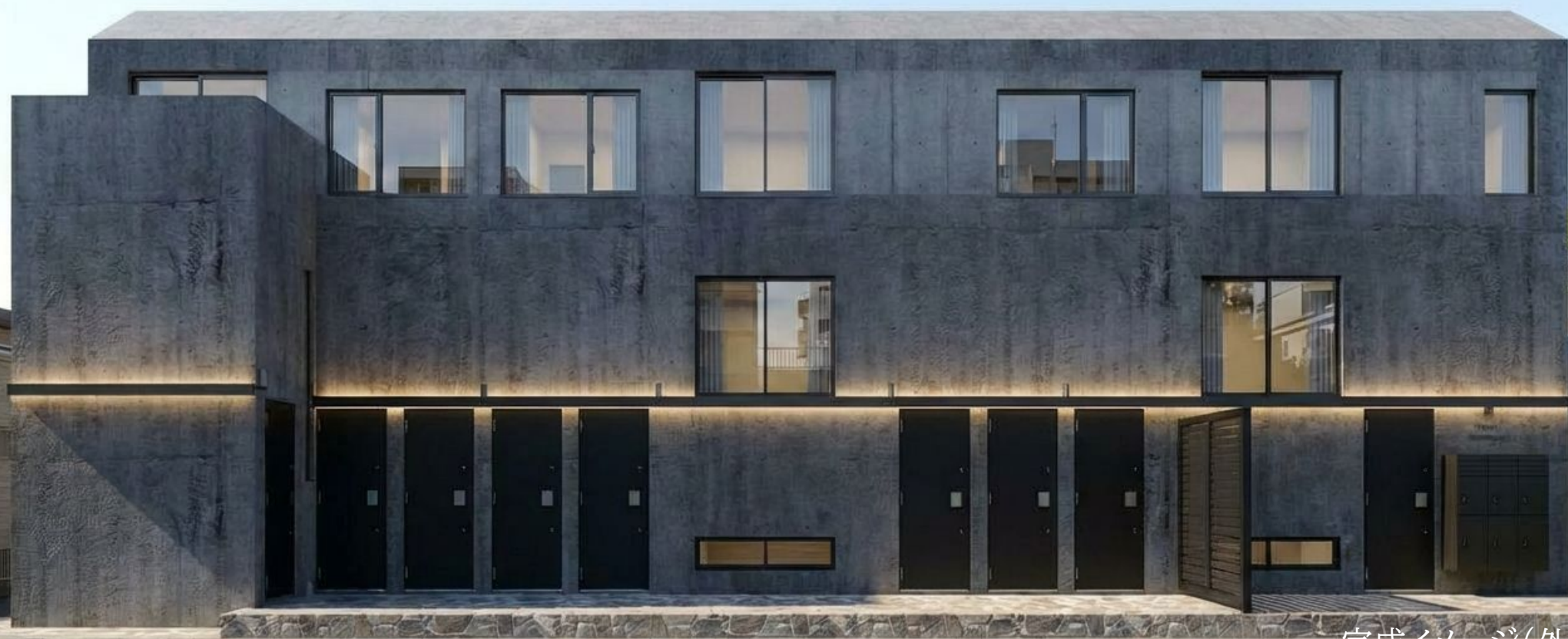
完成イメージ(外観)